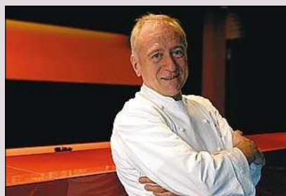
CARLES GAIG GAIG

Es apasionante buscar el juego dulce, ácido, refrescante o amargo en este mix de propuestas lejanas y cercanas (señalemos que el chocolate, el rey-postre, es un producto tropical). Entre los tres grandes postristas de la liga catalana, Gaig, Hofmann y Escribà, el maestro Ochiai y unas delicadezas que se funden en la boca.