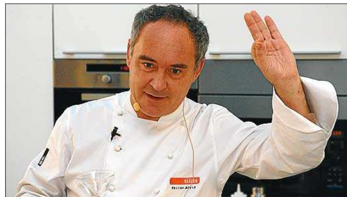
FERRAN ADRIÀ EL BULLI El genio sin fin

El mejor cocinero del mundo, y Català de l'Any 2003, aporta al banquete su gambita con aceite de té. El maestro de la cocina tecnoemocional ha anunciado que en el 2012 cerrará su restaurante (tres estrellas Michelin y elegido como el mejor del mundo ininterrumpidamente desde el 2006 por 'The Restaurant Magazine') para reconvertirlo en fundación.