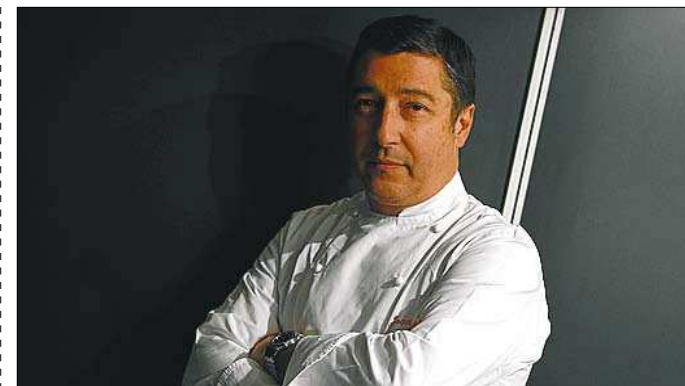
JOAN ROCA EL CELLER DE CAN ROCA La celebración del Año Roca

La única mujer con cinco estrellas Michelin –y finalista del Català de l'Any en el 2008– elabora un 'anko' de 'ganxet' y butifarra negra, que combina la cocina catalana con los sabores japoneses que tan bien conoce. Con restaurante en Tokio desde el 2004, la cocinera más prestigiosa del mundo dirige otro local en el lujoso hotel Mandarin de Barcelona, Moments.