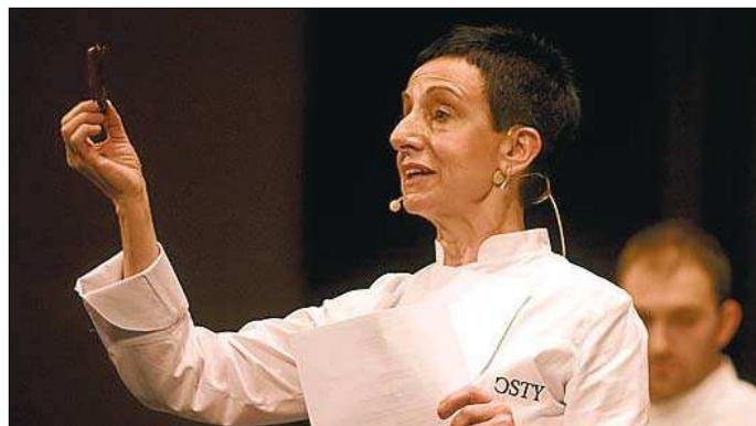
CARME RUSCALLEDA SANT PAU La gran dama de la cocina

El mejor cocinero del mundo, y Català de l'Any 2003, aporta al banquete su gambita con aceite de té. El maestro de la cocina tecnoemocional ha anunciado que en el 2012 cerrará su restaurante (tres estrellas Michelin y elegido como el mejor del mundo ininterrumpidamente desde el 2006 por 'The Restaurant Magazine') para reconvertirlo en fundación.